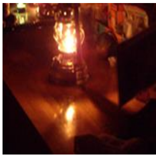
▲キャンドルナイト

そろそろ冷房はOFF、扇風機も押入れに仕舞い込む季節、窓を開けて外の風を入れましょう！上海でないかぎり、室内の空気より外の空気がずっときれいです。