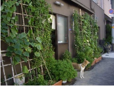
▲入口は夏に緑のカーテンに、今は竹だけ。 人なつっこい犬、ハッピーがいます。