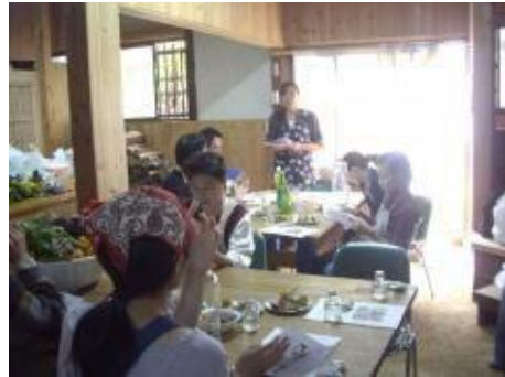
▲室内の壁は珪藻土、杉板張りでエコです。 アトピー・アレルギーの方も気持ちよく参加できます。