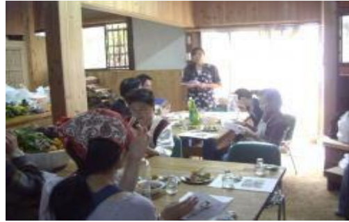
▲室内の壁は珪藻土、杉板張でエコです。 アトピー・アレルギーの方も気持ちよく参加できます。